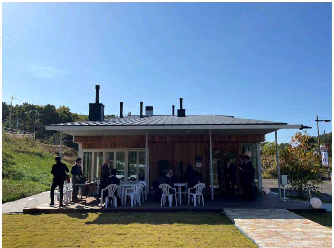
薪おじさん(株)高松空港店 ショールーム屋外テラスでの、職場例会。

本日もご参加いただき、ありがとうございました。引き続きよろしく願いいたします。会長挨拶は以上です。