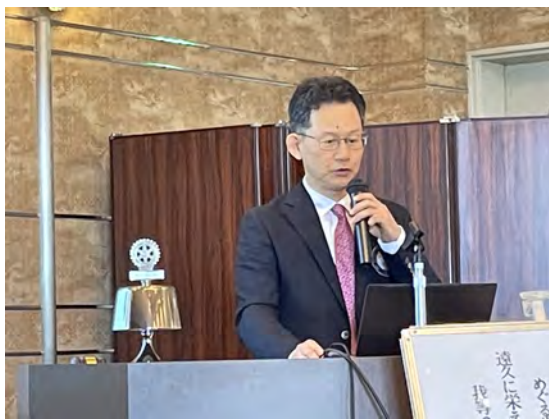
1. 川原新会長 方針演説