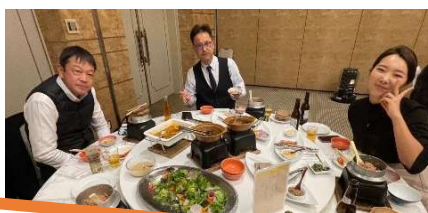
脇町ロータリークラブ・クリスマス会の様子